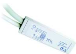
MATT1N Receptor Mini

Receptor externo para motores estándar (no vía radio)