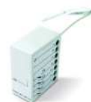
MATT2N Receptor para pulsador

Instalación en exterior: IP55 Dimensiones: 9,8 x 2,6 x 2 cm