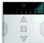
MAP1 Plano 1